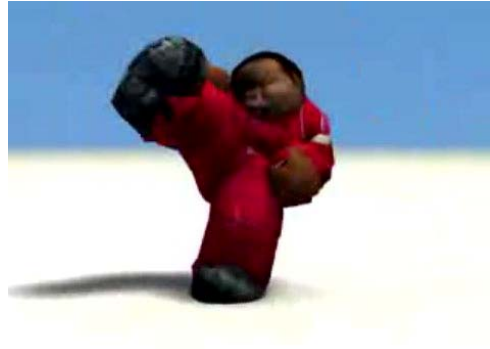
Fig 1 e 2 – Imagem de captura de movimentos de capoeira e integração em personagens 3D ( http://movlab.ulusofona.pt )

Os sistemas mocap são amplamente utilizados em laboratórios de análise do movimento humano para estudos biomecânicos 3 para que, de modo científico, se possam identificar as forças físicas que actuam sobre os corpos, nas articulações, ossos ou tecidos. Em Portugal, o Laboratório de Marcha do Centro de Medicina e Reabilitação, em Alcoitão, monitoriza diversos casos clínicos a partir de um conjunto de tecnologias, onde se insere um sistema Vicon de motion capture baseado em 6 câmaras de infra vermelhos, 4 plataformas de forças AMTI. Este laboratório procura analisar a energia mecânica que é utilizada para a execução de um determinado movimento, ou seja, segundo os objectivos gerais, são definidos os âmbitos de acção do Laboratório de Marcha: